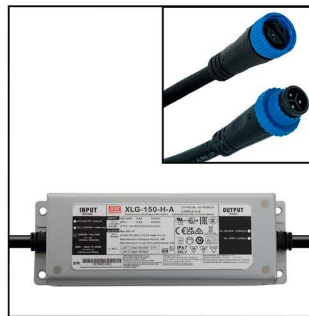
FUENTE DE ENERGÍA input 100-240 V ac output 48 V dc conectores estancos