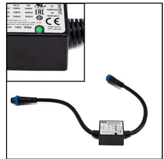
PROTECCIÓN CONTRA SOBRETENSIONES SPD clase II Descargas indirectas hasta 10 kVA Luz indicadora de estado