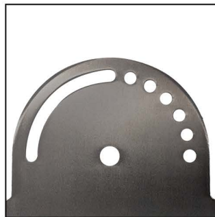
REGULADOR DE ACERO INOX regulación de altura cada 15° y regulación continua 90°