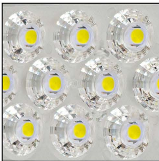
LED DE ALTA EFICIENCIA chip SMD 5050 190lm/W 2700K y 6500K